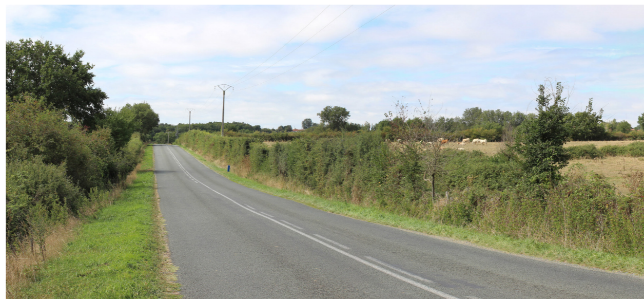
Photographie de l'état initial à 50°